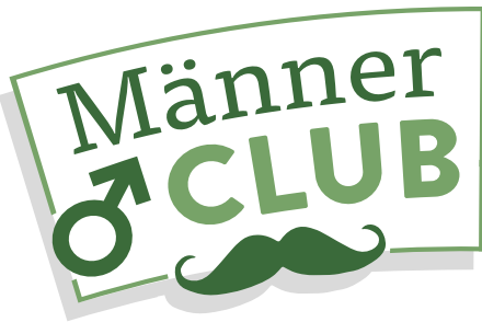
Tourismus: Die Männer stellen die Weichen, die Frauen bewirten die Gäste