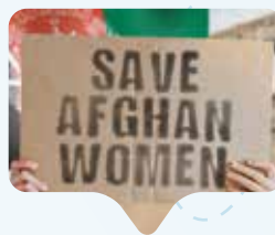
Ancora una volta le donne afgane scendono coraggiosamente in strada per protestare.

L'Onu non ha ancora riconosciuto il governo talebano e ha approvato all'unanimità una risoluzione che lo esorta a revocare rapidamente le sempre più dure restrizioni nei confronti delle donne. Tuttavia, la vicesegretaria generale dell'ONU Amina Mohammed ha dichiarato che potrebbero essere effettuati alcuni passi verso il riconoscimento del governo dei talebani, benché ciò dipenda da una serie di condizioni. Le donne afgane hanno lanciato un coraggioso segnale affinché la difesa delle loro vite e libertà prevalga sugli interessi economici e geostrategici.