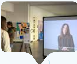
Macht Mut und Lust auf eine wissenschaftliche Karriere: die Kampagne der Uni Bozen

Nur in wenigen Ländern Europas ist die Frauenquote in der Wissenschaft so niedrig wie in Italien, wo laut Eurostat 2022 nur ein Drittel aller Forschenden weiblich ist.