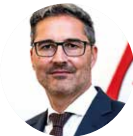
ARNO KOMPATSCHER Landeshauptmann

Sommerzeit ist Reisezeit. Es stellt sich somit auch die Frage, ob es eine Soloreise sein kann/soll oder doch lieber zu zweit oder mit der ganzen Familie. Im Internet finden sich mittlerweile viele Tipps und Portale für Frauen, die alleine reisen möchten. Alleine reisen liegt im Trend. Es gibt dir unendlich Raum und Zeit, deine Gedanken schweifen zu lassen, nachzudenken und in dich zu gehen. Oder doch lieber zu zweit oder mit der ganzen Familie? Auch das hat seine Vorteile: das gemeinsame Teilen von Erlebnissen, Erfahrungen und Situationen. Aber egal für welchen Weg sich Frauen entscheiden, das eigene Bauchgefühl ist auch auf Reisen der beste Wegweiser. Und so, wie im täglichen Leben, sind wir beim Alleinreisen häufig nicht allein. Wir lassen uns auf neue Abenteuer ein, sind offener, sitzen mit fremden Menschen an einem Tisch, erweitern unseren Horizont und unser Netzwerk. Gemeinsame Momente und Aktionen, wie der Equal Pay Day oder die Erarbeitung des Gleichstellungsaktionsplans schweißen uns zusammen und zeigen, was wir erreichen können, wenn wir uns gemeinsam in die gleiche Richtung auf den Weg machen. Die Genehmigung des Plans ist ein wichtiger Meilenstein auf unserem Weg, aber die Reise ist noch lange nicht zu Ende.