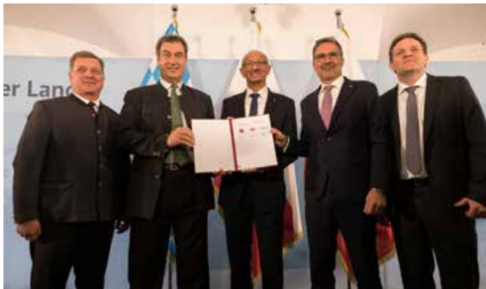
Verkehrsmanagement ist männlich (so wie die Politik)

wie vom Erdboden verschluckt. Vermutlich reinigen sie gerade die letzten Zimmer, decken die Mittagstische ein oder drehen die Speckknödel, während die Herren Präsidenten und Vorstände in der Handelskammer in Bozen den Ergebnissen einer Klausur zu einer effizienteren Zusammenarbeit und klareren Aufgabenteilung zwischen den verschiedenen Tourismusorganisationen in Südtirol lauschen. Na dann, nix wie ran an den Herd, sonst wird das nichts mit den zufriedenen Gästen, die immer wieder gerne wiederkommen.