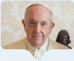
Papst Franziskus öffnet die Bischofssynode für Frauen und Laien

Papst Franziskus versucht neue Wege: Bei der Bischofssynode im Herbst sollen erstmals in der Geschichte der katholischen Kirche Frauen und Laien in größerer Zahl teilnehmen – mit Stimmrecht. Dafür hat der Papst die Regeln für das regelmäßige Treffen der Bischöfe aus aller Welt abgeändert, sodass künftig fünf Ordensschwwestern (zusammen mit fünf Priestern) dieselben Rechte wie die Bischöfe erhalten und mitbestimmen können. Außerdem hat Franziskus 70 stimmberechtigte nicht bischöfliche Mitglieder der Synode ernannt, spricht Priester, Diakone, Ordensleute und Laien, die Hälfte davon Frauen. Damit erhalten Frauen zumindest etwas mehr Entscheidungsmacht, die wichtigen hochrangigen Ämter aber bleiben (noch) in Männerhand. Beim bundesweiten Predigerinnentag der Katholischen Frauengemeinschaft Deutschland Mitte Mai haben daher etwa 90 Frauen bei einer Hl. Messe gepredigt, nachdem der Vatikan Ende März das kirchenrechtliche Verbot der Predigt von Laiinnen in der Eucharistiefeier bekräftigt hatte.