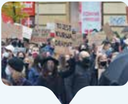
Proteste in Polonia contro la legge sull'aborto nell'ottobre 2020.

Il 14 marzo 2023 l'attivista polacca di Abortion dream team Justyna Wydrzynska è stata condannata a otto mesi di lavori socialmente utili per aver aiutato una donna a procurarsi la pillola abortiva di nascosto dal marito violento e oppressivo. La Polonia, uno degli Stati più proibizionisti in materia, anche a causa di frange ultra-cattoliche che hanno un peso importante nelle scelte politiche, ha una delle leggi sull'aborto più severe dell'UE. È consentito interrompere una gravidanza solo nei casi in cui la salute o la vita della madre siano minacciate o la gravidanza sia il risultato di stupro o incesto. Justyna Wydrzynska commenta così la condanna subita: "Non mi sento affatto colpevole, so di essere nel giusto. Non ho paura della sentenza, non ci lasceremo intimidire da quei politici che vogliono tapparci la bocca. E a tutti quelli che vivono in Polonia dico: non ci fermeremo".