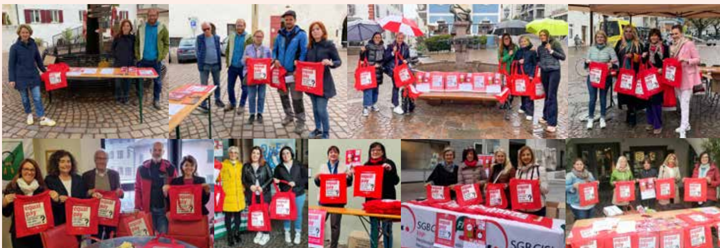
Landesweit informieren und sensibilisieren Frauen in Südtirol – danke fürs Mitmachen auch in diesem Jahr!