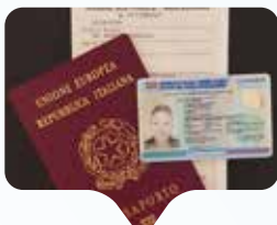
La documentazione amministrativa ha tuttora un linguaggio esclusivamente maschile.

Recentemente la prestigiosa istituzione linguistica Accademia della Crusca, pur dichiarando che "è senz'altro giusto prestare attenzione alle scelte linguistiche relative al genere", si è espressa contro l'utilizzo di schwa, asterischi e genere neutro. Questa posizione non chiude di certo il dibattito sul linguaggio inclusivo.