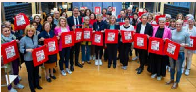
Die roten Taschen sind das Symbol schlechthin für Lohnungerechtigkeit