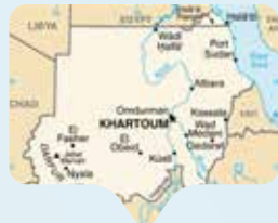
Le violenze nel Sudan, iniziate nel 2003, sono nuovamente esplose con forza.

Dal 15 aprile 2023 il Sudan è tornato ad essere martoriato da conflitti. I combattimenti tra l'esercito sudanese e i paramilitari delle Forze di supporto rapido (Rsf) si concentrano soprattutto nella capitale Khartoum, una città di 5 milioni di abitanti, che in migliaia hanno abbandonato, e nelle regioni occidentali del paese, in particolare il Darfur. Il Sudan e l'intera regione rischiano di sprofondare nel caos e a farne le spese è la popolazione civile, donne in primis. Amnesty International ha affermato che in questi anni di continui conflitti "i civili in Sudan sono sottoposti a violenze estreme: migliaia sono stati uccisi e innumerevoli altri hanno patito la fame e la disidratazione e sono stati colpiti da malattie; centinaia di villaggi sono stati distrutti; innumerevoli mezzi di sussistenza sono stati rovinati; stupri e altre violenze sessuali nei confronti di donne e ragazze sono stati frequenti."