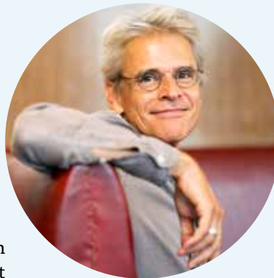
Thomas Brezina hat sich zum 60. Geburtstag ein Buch geschrieben.

Normalerweise stellt die eres in dieser Rubrik „literarische Frauenstimmen“ Autorinnen vor, dieses Mal ist die Wahl ausnahmsweise auf einen Mann gefallen, den die eine und andere noch aus Kindertagen kennen dürfte: Thomas Brezina.