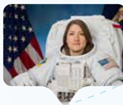
Auf Mondmission: Christina Koch

Die 32 Astronauten, die bislang an den Mondflügen der zivilen US-Bundesbehörde für Raumfahrt und Flugwissenschaft beteiligt waren, waren alles Männer. Nun ist erstmals in der Geschichte der Raumfahrt eine Frau für eine Mondmission ausgewählt worden: die 44-jährige Christina Koch. Die amerikanische Astronautin ist kein unbeschriebenes Blatt in der Raumfahrtsszene, sondern die Frau mit dem längsten Weltraumaufenthalt am Stück: 328 Tage. Die italienische ESA-Astronautin Samantha Cristoforetti mit Trientner Wurzeln war übrigens zuletzt knapp 200 Tage im All. Neben der Ingenieurin Christina Koch ist mit Pilot Victor Jerome Glover erstmals auch eine Person of Colour an einer Mondmission beteiligt. Ziel des vierköpfigen