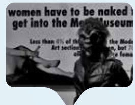
Für Chancengleichheit in der Kunstwelt: die Guerilla Girls

Do women have to be naked, to get into the Met.Museum? Müssen Frauen nackt sein, um ins Met.Museum zu kommen? Mit ihrem legendären Poster machten die Guerilla Girls im Jahr 1989 in New York darauf aufmerksam, dass im Metropolitan Museum of Art weniger als fünf Prozent Künstlerinnen ausstellen, aber 85 Prozent der nackten Körper auf den Kunstwerken Frauen sind. Ziel der Aktivistinnengruppe ist es bis heute, auf die Ungleichheit zwischen den Geschlechtern im Kunstbetrieb aufmerksam zu machen und eine Gleichbehandlung in der Kunstwelt zu erreichen. Die Aktivistinnen treten dabei anonym auf, benutzen Gorillamasken und verwenden Pseudonyme wie die Namen verstorbener Künstlerinnen. Das Museum für Kunst und Gewerbe (MK&G) in Hamburg zeigt in seiner aktuellen Ausstellung „The F*word – Guerrilla Girls und feministisches Grafikdesign“ noch bis zum 17. September nicht nur kritische Plakate der Gruppe, sondern auch eine eigene Arbeit der Künstlerinnen, welche die Sammlung des Museums kritisch unter die Lupe nimmt. Infos unter www.mkg-hamburg.de .