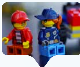
Eltern stärken ihre Kinder oft nicht ausreichend in ihrem Streben nach Individualität.

Das dänische Klötzchen-Imperium macht Nägel mit Köpfen und schafft die Einteilung nach Jungs- und Mädchenspielzeug in seinem Sortiment ab. Dieses soll in Zukunft nach Interessen, Themen und Altersgruppen geordnet werden. Laut einer von Lego selbst in Auftrag gegebenen Studie sind die Einstellungen zum Spielen und zur Berufswahl immer noch von Geschlechterklischees gekennzeichnet. Dabei sind es bei weitem nicht nur die Mädchen, die in bestimmte Rollen gedrängt werden: Während Mädchen immer öfter lernen, dass auch sie Berufe ergreifen können, die traditionell eher von Männern ausgeübt werden, werden Jungs oft nicht zu mehr Selbstbewusstsein erzogen, damit sie sich an typisches „Mädchenspielzeug“ trauen. Die Firma ruft vor allem die Eltern dazu auf, ihren Kindern zu vermitteln, dass sie die freie Wahl haben – offenbar tragen diese nämlich dazu bei, Geschlechterklischees noch zu zementieren statt aufzuweichen.