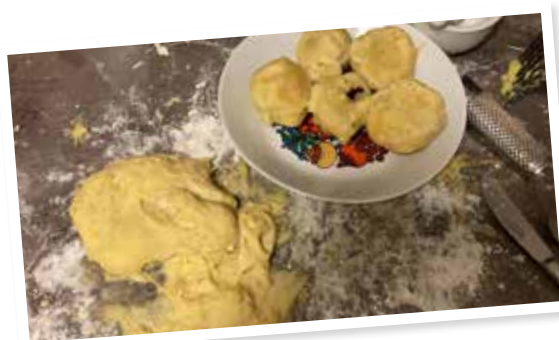
Rezepte für den ultimativen Zwetschgenknödelteil bitte an die ères -Redaktion

Ok, dann nennt es halt Menschenrechte, wenn euch das F-Wort solche Angst macht. Brauchen wir die? Also dass niemand wegen seines Geschlechts, seiner Hautfarbe, seiner Herkunft, seiner Sexualität etc. diskriminiert werden darf? Ja, das wäre schon irgendwie wichtig und ist aber blöderweise noch immer nicht der Fall? Na bitte, geht doch.