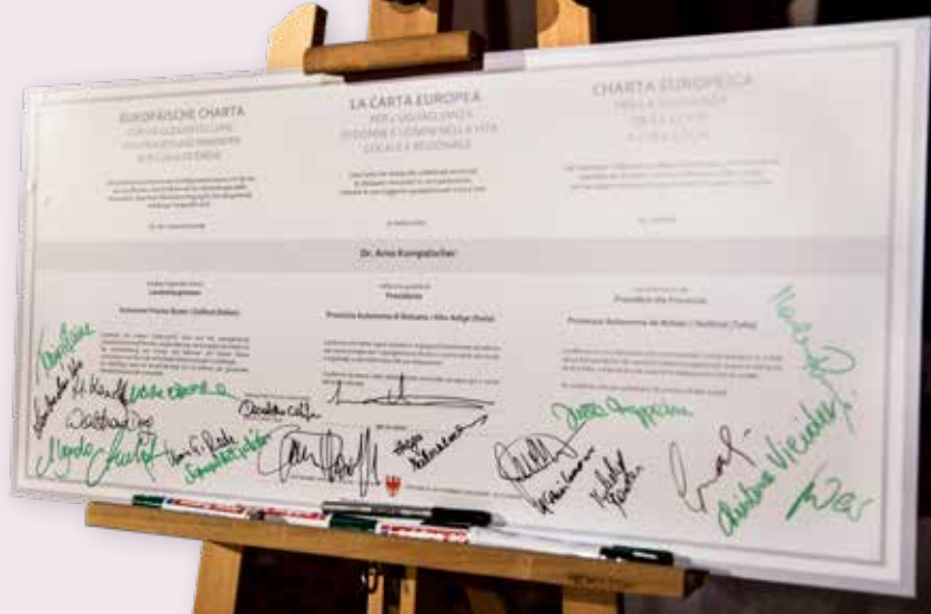
Symbolisch wurde die Charta auch von den anwesenden Vertreterinnen der Frauenorganisationen und -vereinigungen mitunterzeichnet.

Musikalisch umrahmt wurde die Feier von Giada Bucci & Friends mit einer Auswahl von Musikstücken von und mit Frauen aus mehreren Jahrzehnten Musikgeschichte.