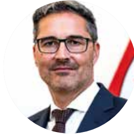
ARNO KOMPATSCHER Landeshaupmann

Stereotips á porté pro che les iniustizies y les desvalianzes sides aumentades tratan la pandemia Covid, canche propi les ères che laora, y suradöt les umes che laora, á paíe le prisc plü alt. Nosc rengraziamënt vá ince a ères.