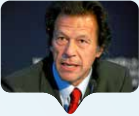
Imran Khan criticato per il suo commento sul vestiario di vittime di stupro.

Seguono le proteste contro un alto funzionario del governo pakistano che a Lahore ha pubblicamente accusato una donna di essere colpevole del suo stupro, in quanto aveva osato uscire di casa nelle ore notturne. La polemica ha avuto forte riscontro sul web, facendo sì che ora attiviste di tutto il mondo, si stanno impegnando per il licenziamento di tale funzionario e per la tutela delle donne vittime di violenza sessuale. Ulteriore scandalo ha provocato il primo ministro Imran Khan quando di recente ha detto che il vestiario femminile ha sempre un impatto sugli uomini. Purtroppo in Pakistan i casi di colpevolizzazione delle vittime sono la norma, così come il fatto che le accuse di stupro vengono raramente esaminate dalla legge portando ad arresti e condanne effettive.