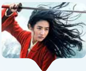
Mulan - l'eroina cinese della Disney contestata.

La Disney sta lavorando alla produzione cinematografica della storia leggendaria di Mulan, una giovane guerriera travestitasi da uomo per poter combattere in guerra. La storia è ambientata nel nord della Cina ed il film è stato girato a Xinjiang, una provincia in cui circa un milione di persone della minoranza musulmana uiguri sono state imprigionate in campi di detenzione senza nessuna accusa o sentenza. Durante le riprese, la Disney ha collaborato con le autorità