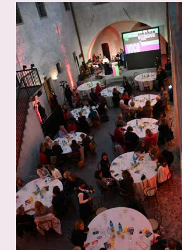
Zahlreiche Gäste feierten auf Schloss Maresch das 30-jährige Bestehen des Landesbeirats für Chancengleichheit für Frauen.