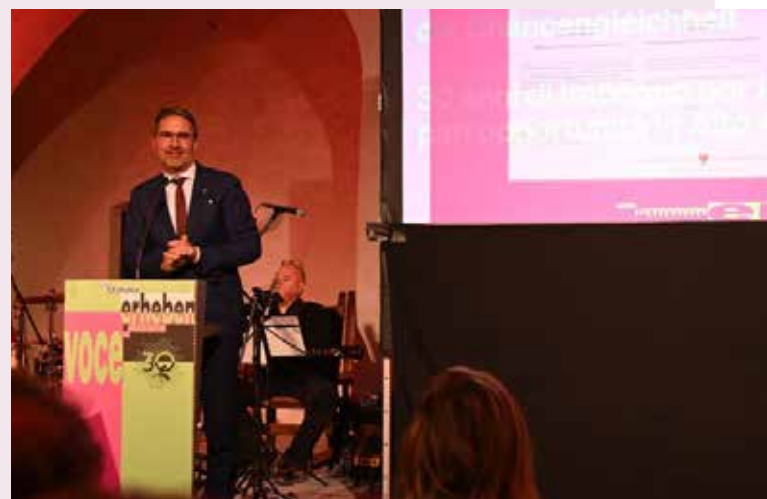
„Mehr Gleichberechtigung macht die gesamte Gesellschaft zu einer besseren“, unterstrich Landeshauptmann Arno Kompatscher bei der 30-Jahr-Feier des Landesbeirates für Chancengleichheit.