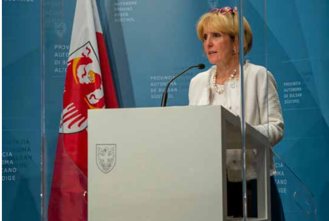
Landesrätin Deeg am 31. August bei der Vorstellung der Details des neuen Landesgesetzes