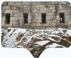
Durchaus stimmungsvoll: Die Festung im Winter.

Mit dieser Aktion soll nicht nur den weiblichen Kunstschaffenden eine Plattform geboten, sondern auch die Aufmerksamkeit auf ihre Tätigkeit gelenkt werden. Gleichzeitig ist dies eine gute Möglichkeit des Neuanfangs nach den vergangenen eineinhalb Jahren, die für Künstler*innen besonders hart waren. Das Projekt soll als Biennale oder Triennale in den nächsten Jahren wiederholt werden.